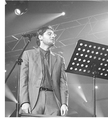
سامي يوسف في إحدى حفلاته

ثم غادر المكان من الباب الخلفي للقاعة سامي يوسف وصلى اليمن مساء الثلاثاء قبل الماضي . وكان في استقباله عدد كبير من محبيه في صالة مطار صنعاء ويأتي مجيئ سامي يوسف إلى اليمن بدعوة من مؤسسة سيف للإبداع التي كان له الكثير من الأنشطة المختلفة في هذا المجال.